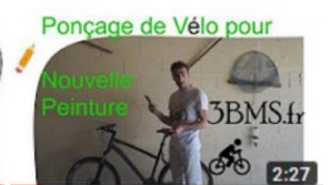
Projet Vélo : 1/4 Tuto Ponçage 2:27