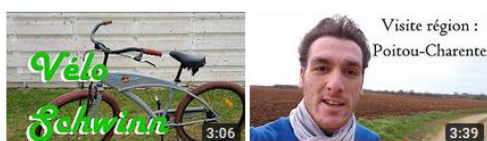
Essai Beach Cruiser Schwinn