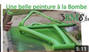
Projet vélo 3.1 / 4 : Tuto peinture à la Bombe 5:11