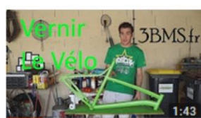
Projet Vélo 3.2 / 4 : Tuto Vernir le Cadre 1:43