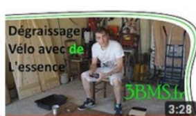
Projet vélo : 2/4 Tuto Dégraissage des Pièces 3:28