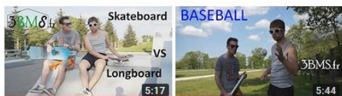
Comparaison Skate Vs Longboard