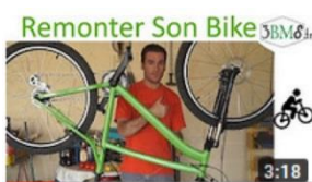
Projet vélo 4/4 : Tuto Remontage des pièces 3:18